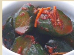
オイキムチ 辛口 500g