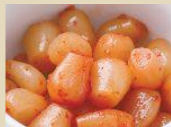
らっきょうキムチ 500g