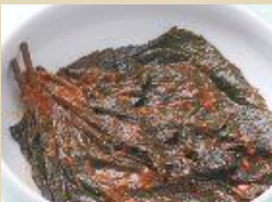
えごまの葉 味噌漬け 200g