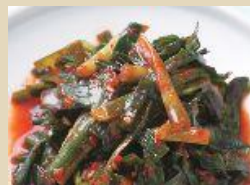
ニラキムチ(カット) 500g