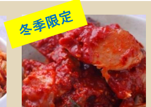
冷凍 ケジャン 500g