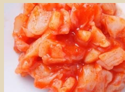
冷凍 つぶ貝キムチ 300g