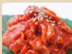
チャンジャ 500g (真空)