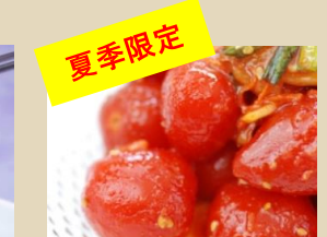
トマトベリーキムチ 500g