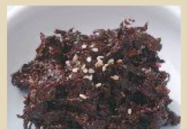
冷凍 のり漬け 500g