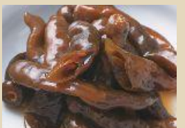
青唐辛子 醤油漬け 500g