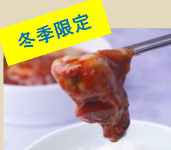
冷凍 カキキムチ 300g