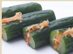
オイソバギ 1/2カット 8本入り