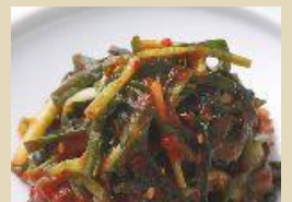
小ねぎキムチ(カット) 500g