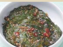
えごまの葉 醤油漬け 200g